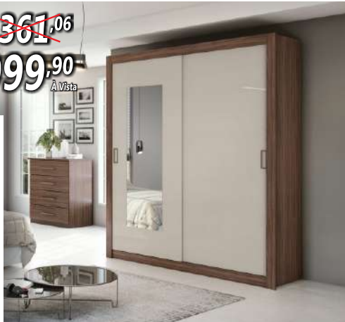
GUARDA ROUPAS APOENA

DE R$ 1.361,06 20% POR R$ 999,90 À Vista