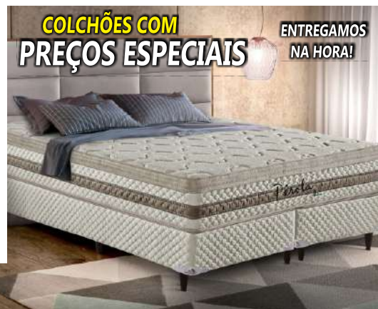
COLCHÕES DE SOLTEIRO, CASAL, QUEEN E KING

Frete GRÁTIS para Cachoeira de Minas e Paraisópolis