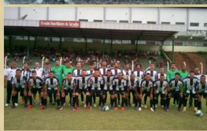
Atlético - Campeão Regional - 2017.