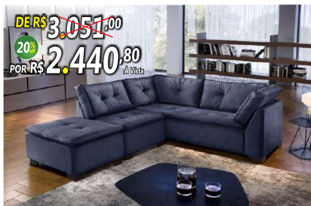
SOFÁ DE CANTO VERSÁTIL

DE R$ 3.051,00 20% POR R$ 2.440,80 À Vista