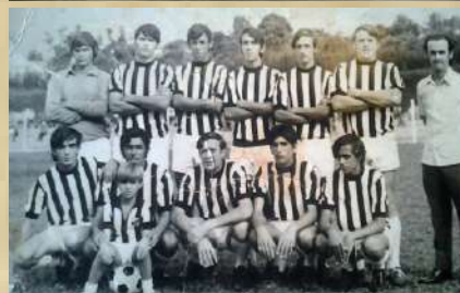
Atlético - O time do retorno - 1971.