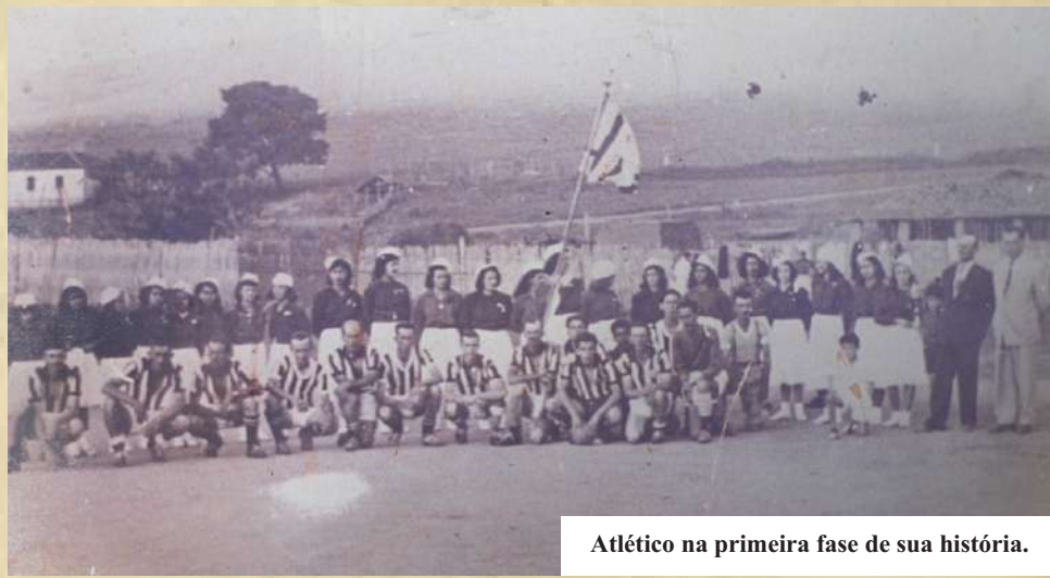
Atlético na primeira fase de sua história.