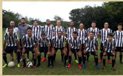
Atlético - Equipe Atual