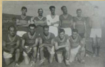
Atlético - Primeira equipe Campeã - 1947.

O Clube Atlético Ourense está entre as maiores e mais fanáticas torcidas amadoras do Sul de Minas. O clube adotou o escudo e a camisa listrada do Atlético Mineiro e a sigla CAO. O mascote do time é o Galo.