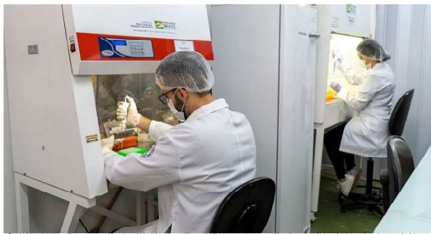
Os laboratórios de campanha também irão avaliar a utilização de uma técnica de diagnóstico simples e rápida que utiliza uma pequena amostra de saliva.

A pandemia de Covid-19 tem causado grandes impactos na saúde da população e na economia global, demandando ações de controle e acompanhamento que permitam a manutenção segura das atividades econômicas com ações planejadas e direcionadas. Uma estratégia efetiva para conter o avanço do número de casos de Coronavírus é o diagnóstico em massa. Pensando nisso, o Governo Federal, por meio do MCTI - Ministério de Ciência, Tecnologia e Inovações, está promovendo a instalação de laboratórios de campanha dentro de universidades públicas.