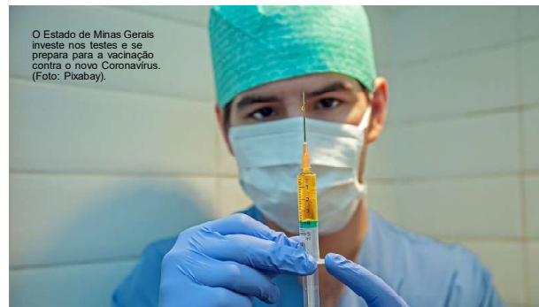
O Estado de Minas Gerais investe nos testes e se prepara para a vacinação contra o novo Coronavírus.

Feitos com materiais nacionais, kits permitirão análises mais baratas e mais precisas