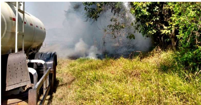
CAMINHÃO PIPAAJUDA COMBATER INCÊNDIO NOS ARREDORES DO BAIRRO MONTE BELO; SEGUNDA-FEIRA (01.0)